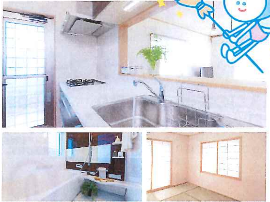
※フッ素の効果をいつまでも持続させるために、定期的なメンテナンスをおすすめします。