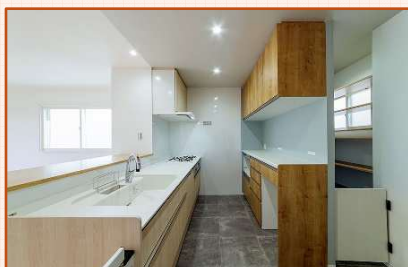
間仕切りを撤去した開放的なLD空間