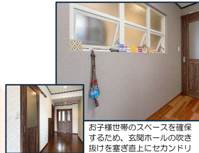
お子様世帯のスペースを確保 するため、玄関ホールの吹き 抜けを塞ぎ直上にセカンドリ ビングを設けました