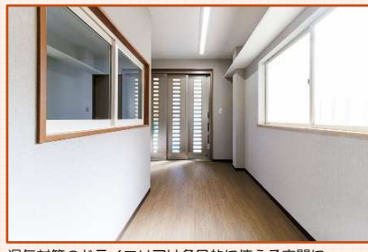
湿気対策のドライエリアは多目的に使える空間に