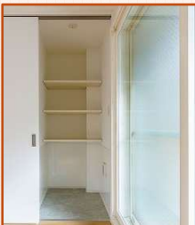
収納と思いきや、実はベッ トちゃんのスペース