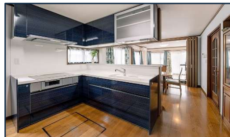
大家族の団らんを創る開放的なLDK空間