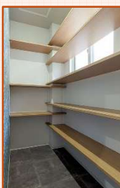
大容量のパントリー