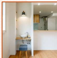
リビングにも手洗いを