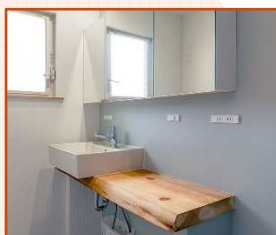
収納が他に確保できたので洗面はシ ンプルでスタイリッシュに