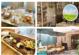
※掲載の航空写真は計画地周辺を2023年2月に撮影したものにCG加工したもので、実際とは異なります。※光の柱は、現地の位置を表現したもので建物の規模や高さを示すものではありません。※掲載の徒歩分数は現地からのもので1分を80mで算出し、端数を切り上げたものです。※掲載の環境写真は、2023年4月に撮影したものです。