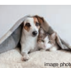
ペット可マンション ※ペットの種類・大きさ・頭数などには制限があります。