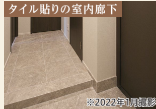
タイル貼りの室内廊下

※掲載の間取りは設計図書を基に描き起こしたもので、実際とは多少異なる場合があります。