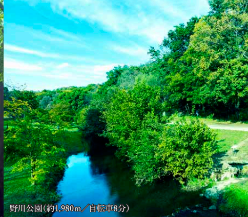
野川公園(約1,980㎡/自転車8分)