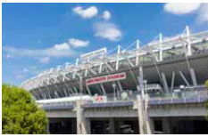
味の素スタジアム (約900m/徒歩12分)