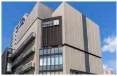
武蔵府中 ル・シーニュ