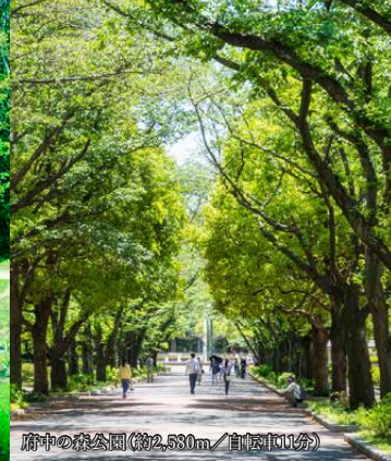
府中の森公園(約2,530㎡/自転車10分)