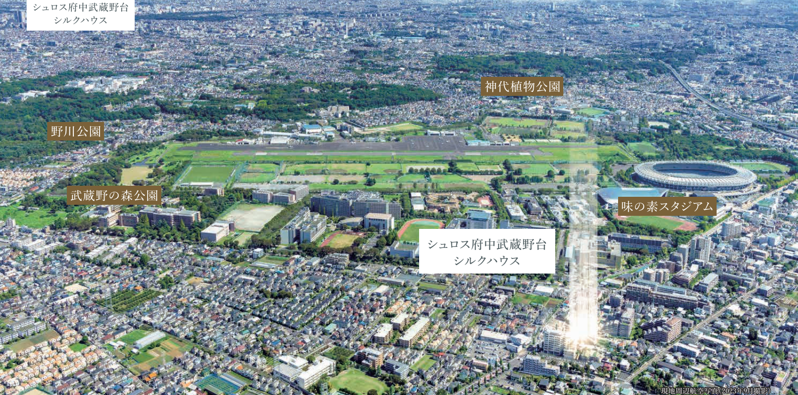
現地周辺航空写真(2023年9月撮影)