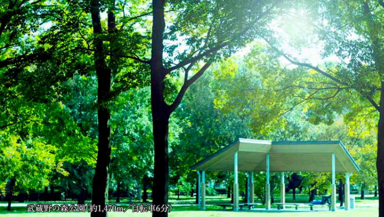
武蔵野の森公園(約1,470㎡/自転車6分)