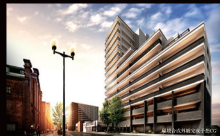
環境合戦外観完成予想CG