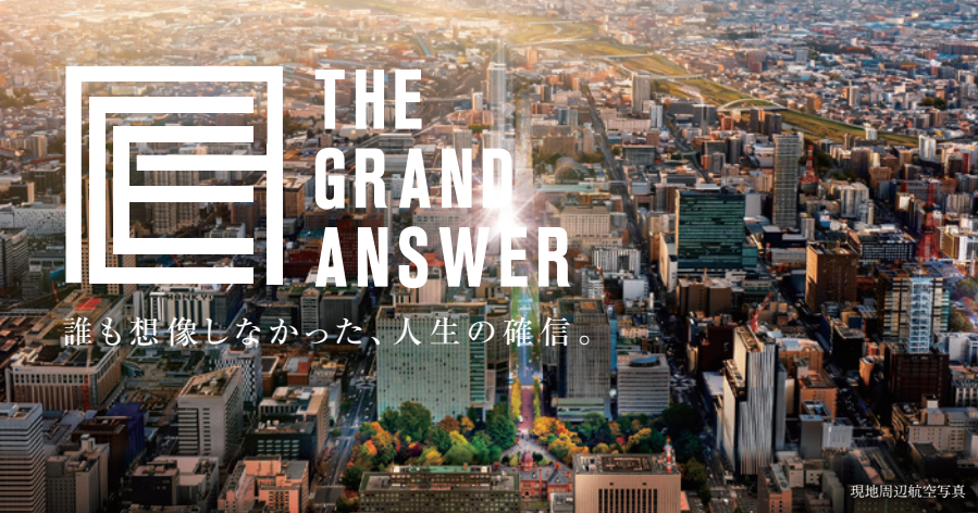
現地周辺航空写真