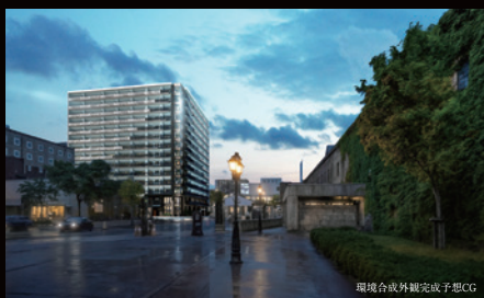
環境合戦外観完成予想CG