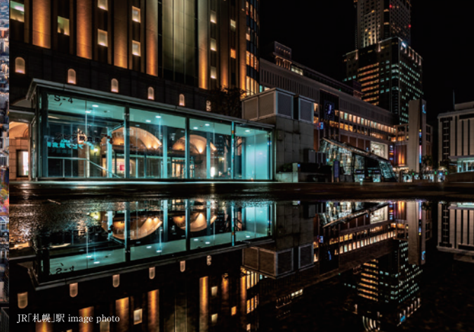
JR札幌駅 image photo