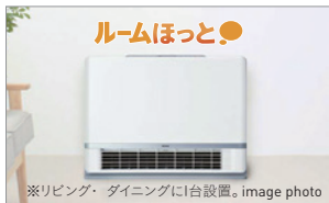
温水ルームヒーター