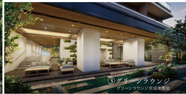
③ グリーンラウンジ グリーンラウンジ完成予想図