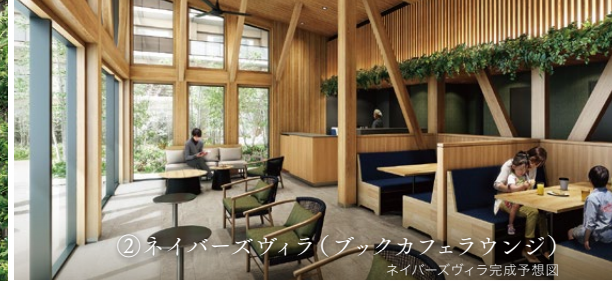
② ネイバースヴィラ(ブックカフェラウンジ) ネイバースヴィラ完成予想図