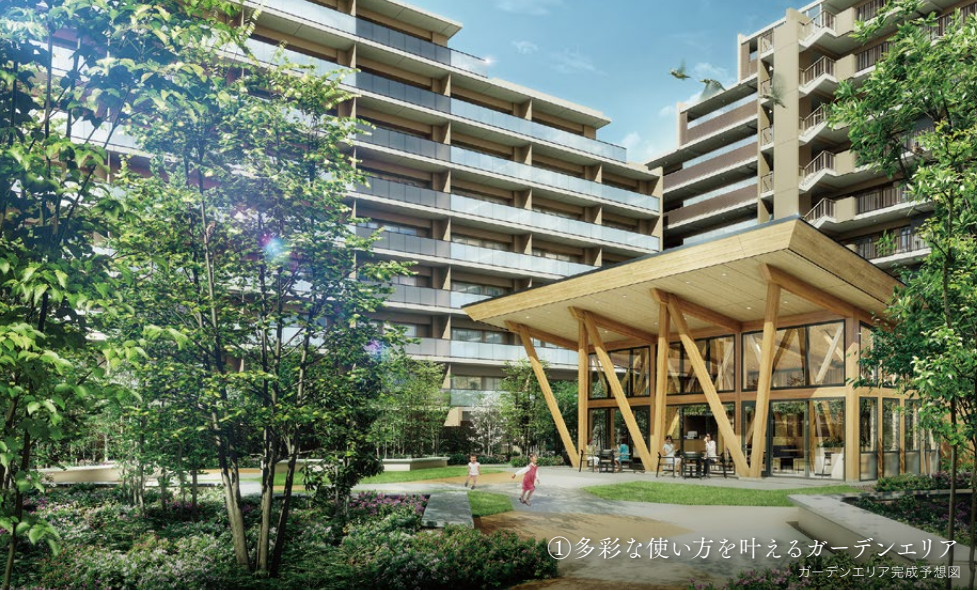
① 多彩な使い方を叶えるガーデンエリア ガーデンエリア完成予想図