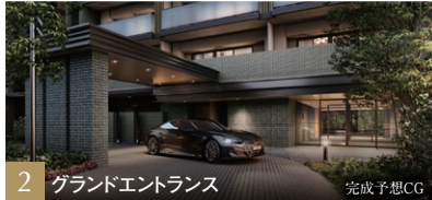
2 グランドエントランス