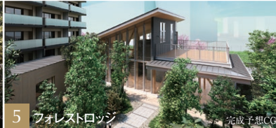
5 フォレストロッジ