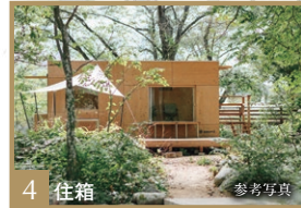
4 住箱 参考写真

snow peak outdoor lifestyle brand since 1958