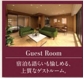
Guest Room ゲストルーム

LAND PLAN 快適・安全・安心へのこだわりが、細部にまで息づくランドプラン。