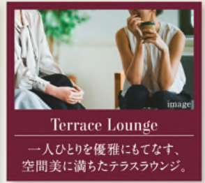
Terrace Lounge テラスラウンジ