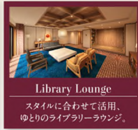
Library Lounge ライブラリーラウンジ