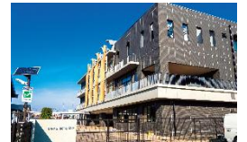
松阪市立鎌田中学校 徒歩7分(約550m)

「イオンタウン松阪船江」が身近な生活圏。国道166号・23号線への接続も良く、松阪IC利用で県外へも簡単に。通勤や日々のお買い物、休日のお出かけもストレスフリーな機動力のあるポジションです。