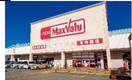
マックスバリュ松阪中央店 徒歩6分(約460m)