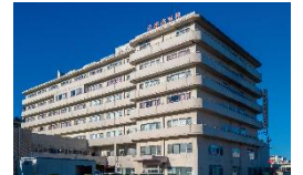
済生会松阪総合病院 徒歩3分(約170m)