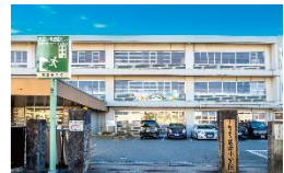
松阪市立第四小学校 徒歩7分(約540m)