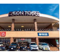
イオンタウン松阪船江。車で約4分(約210m)

「イオンタウン松阪船江」が身近な生活圏。国道166号・23号線への接続も良く、松阪IC利用で県外へも簡単に。通勤や日々のお買い物、休日のお出かけもストレスフリーな機動力のあるポジションです。