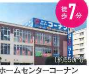
ホームセンターコーナン (約550m)