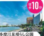
多摩川見晴らし公園 (約760m)