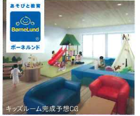
キッズルーム完成予想CG