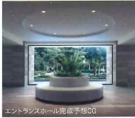
エントランスホール完成予想CG