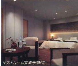
ゲストルーム完成予想CG