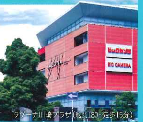
ラゾーナ川崎プラザ (約1180・徒歩15分)