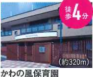
かわの風保育園 (約320m)