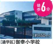
[通学区] 御幸小学校 (約450m)