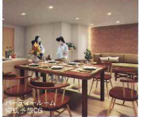
バーベキュールーム完成予想CG