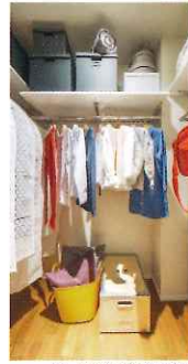
ウォークインクローゼット(可動棚)

豊富な収納 大型ウォークインクローゼットと布団クローゼットをご用意し、たっぷり収納量を確保しました。