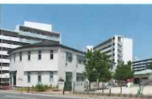
認定こども園 くるみ幼稚園 徒歩6分/約480m