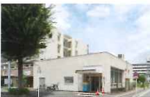
柏市図書館/豊四季台分館 徒歩6分/約480m