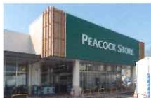
ピーコックストア豊四季台店 徒歩5分/約380m

新商業施設(※1)によって、さらに生活利便性の高まりが期待される「豊四季台」。景観重点地区ならではの自然の潤いに包まれたロケーションとなります。