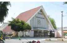
豊四季保育園 徒歩2分/約90m