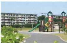
豊四季公園 徒歩7分/約530m