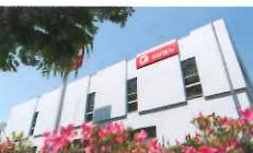
千葉銀行/柏西口支店豊四季特別出張所 徒歩6分/約430m

■「デュオヒルズ柏」物件概要 ●所在地/千葉県柏市豊四季台二丁目937番76(地番) ●交通/JR常磐線「柏」駅・東武野田線「柏」駅 徒歩13分 ●総戸数/住戸154戸(他に管理事務室1戸、キッズスペース1戸) ●敷地面積/5,699.24㎡ ●用途地域/第一種中高層住居専用地域 ●構造・規模/鉄筋コンクリート造12階建 ●駐車場/113台(平置駐車場47台・専用平置駐車場6台・機械式駐車場59台・来客用駐車場1台)(月額使用料:未定) ●自転車置き場/308台(二段ラック式280台、サイクルポート10区画20台、専用サイクルポート4区画8台)(月額使用料:未定) ●バイク置場/8台(月額使用料:未定) ●入居時期/2019年9月下旬予定 ●管理形態/管理組合結成後、株式会社フージャースリビングサービスに委託(通勤) ●売主/株式会社フージャースコーポレーション ●設計・施工・監理/株式会社長谷工コーポレーション ●予告販売概要 ●販売戸数/未定 ●予定販売価格/未定 ●専有面積/67.71㎡~85.46㎡ ●間取り/3LDK~4LDK ●バルコニー面積/7.6㎡~14.5㎡ ●広告作成年月日/平成30年4月12日